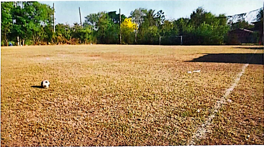
หมู่ 1 บริเวณหลังวัดห้วยโรง